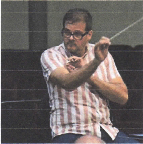
10. Participé en la presentación del VIII Concierto de la Temporada Popular, realizado el 19 de septiembre de 2018, en el Teatro Fantasía del IRTRA Petapa.